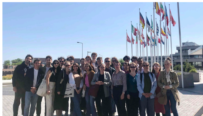
Voyage d'étude au Luxembourg, mai 2023

Le socle commun continuera à allier connaissances spécialisées et mises en situation professionnalisantes. Nous tenons à ces enseignements transversaux, qui jouent un rôle crucial dans l'identité du Master et dans le sentiment d'appartenance des promotions, si important pour la constitution du futur réseau professionnel.