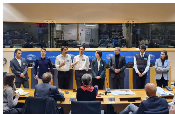
Les groupes de travail

Dans ce domaine, la nouvelle offre de formation innove en proposant aux étudiant.e.s, dès la 4 e année-Master 1, des « Ateliers de recherche » en sous-groupes, où ils pourront se former aux techniques d'enquête et de terrain en étant encadrés par des enseignant.e.s-chercheur.es expérimentés.