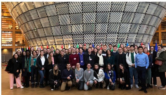
Voyage d'étude à Bruxelles, janvier 2023