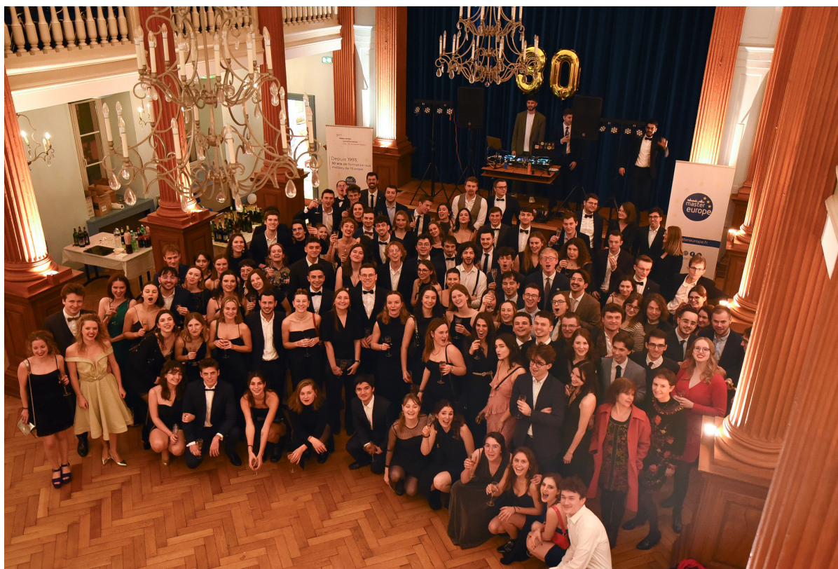
Le Gala des 30 ans du Master Europe en décembre 2023