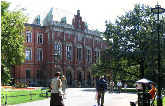
Université de Jagellonne Cracovie, Pologne