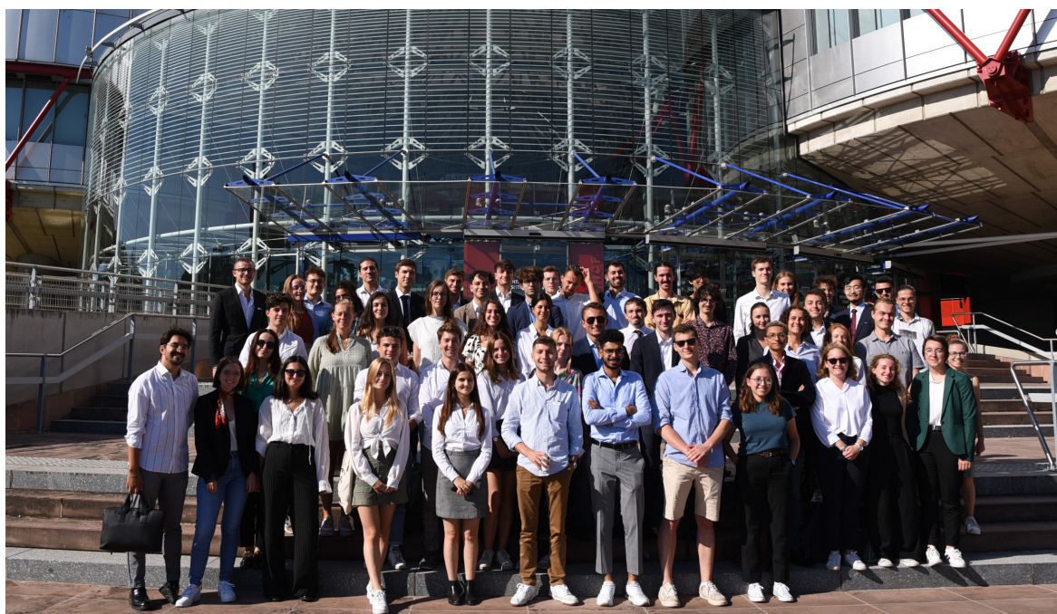
Les étudiants du Master devant la Cour européenne des droits de l'homme en septembre 2023