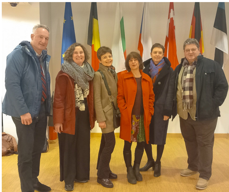
L'équipe pédagogique du Master lors du voyage à Bruxelles en janvier 2024