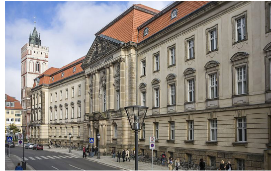
Université de la Viadrina Francfort-sur-l'Oder, Allemagne